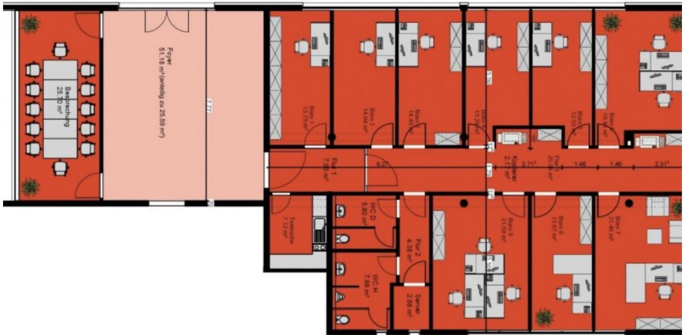
Grundrissplan EG (Grundriss)