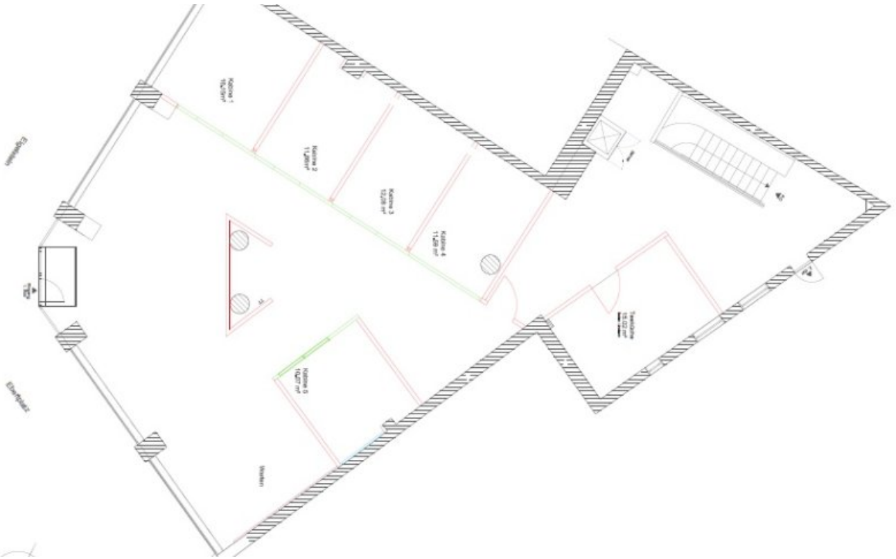
Grundrissplan EG 239qm+UG65qm (Grundriss)