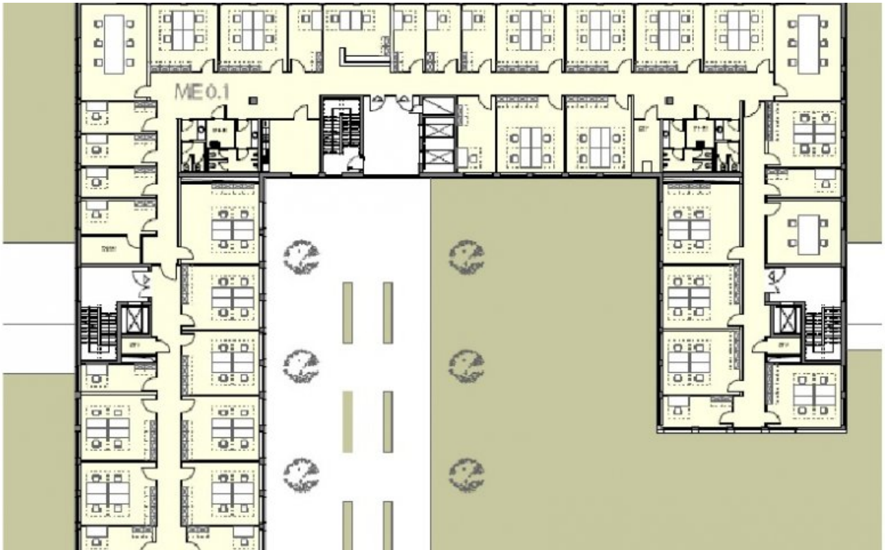
Grundrissplan Beispiel (Grundriss)